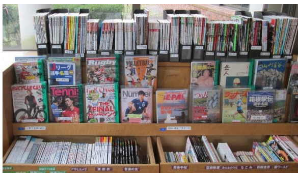
秦野市立図書館の雑誌コーナー