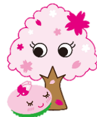
さくらっ子・ もちっ子