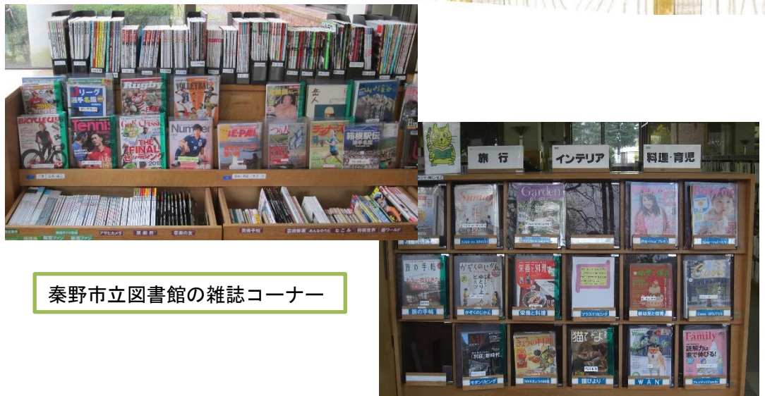
秦野市立図書館の雑誌コーナー