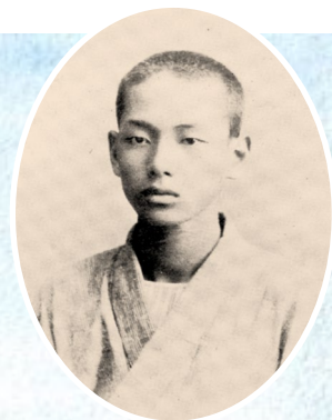
郷土出身の歌人 前田夕暮、15歳の肖像 (明治31年)

向日葵は 金の油を身にあげて ゆらりと高し 日のちひささよ 大正三年七月作 出典「詩歌」 (大正三年八月号)