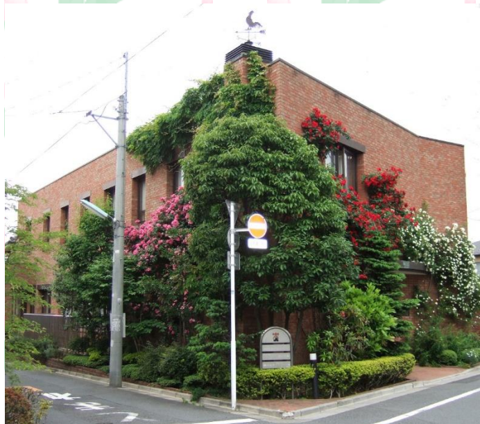
東京子ども図書館