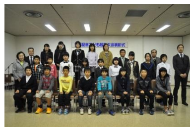
【第28回夕暮記念こども短歌大会表彰式】