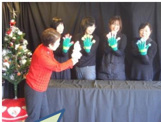
「おはなしアリス」のクリスマス人形劇♪